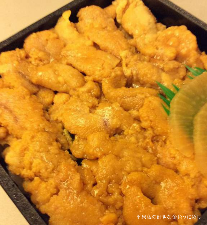
平泉私の好きな金色うにめし

おーっとちょうど列車が来たで〜。ほならまずビールをブッシュ！アペタイザーに「伊達むすび」からいただきます。ほお〜なかにタンかつを挟んどるんかあ〜。レンジでチ〜んとしたばかりやからホカホカでこれは美味しい！あっという間の完食や!! ではメインと行きまっか。ウヒョー！こりやたまらん!!