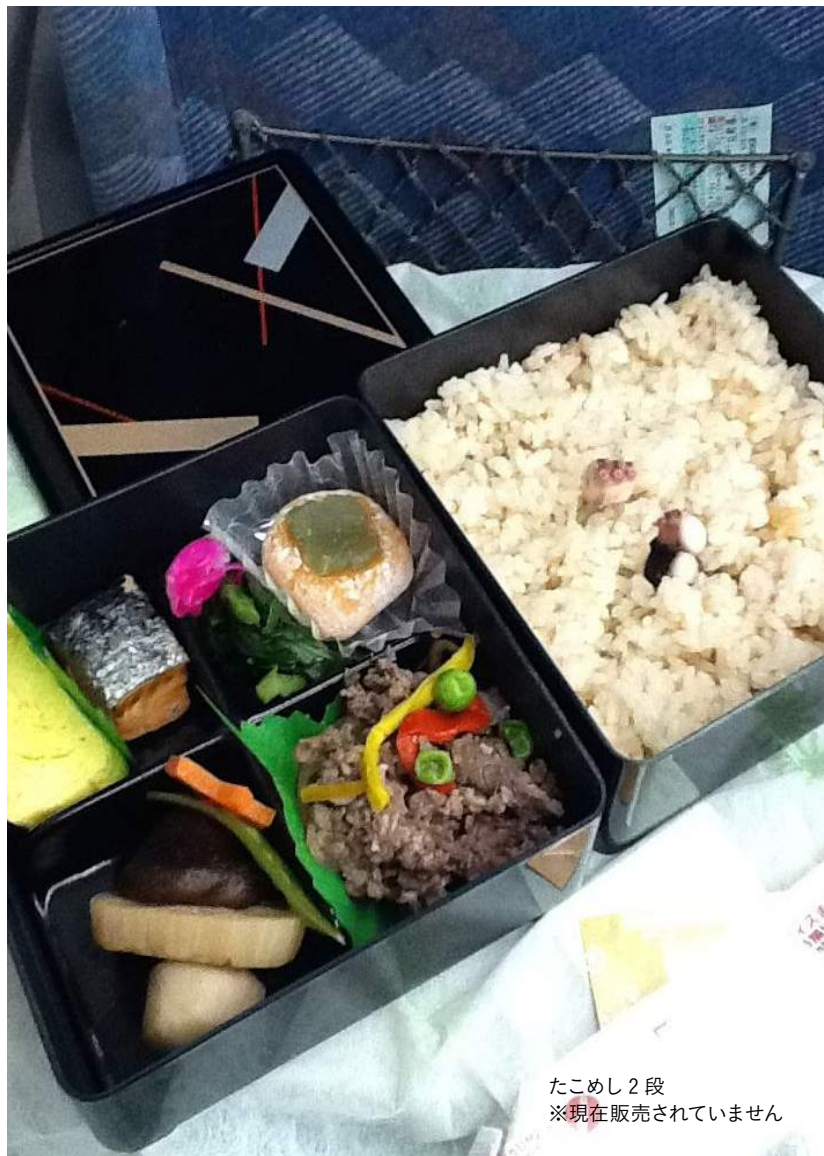
たこめし2段 ※現在販売されていません

今日選んだのはつまみ用に「たこめし2段」これは期間限定らしく、今では売ってへんけど。一の重見たらわかるやろ、酒が進むおかずが入っとる。これやったらビールの500ml 缶2本は楽勝やで!! 新大阪から米原までは新幹線の最高速度 285 km が出せる区間、こっちはゆったり飲りながら… 新幹線はビューとな、ほんま気持ちええで～。