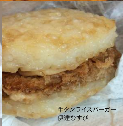
牛タンライスバーガー 伊達むすび